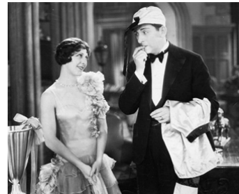
1929 THE HOTTENTOT de Roy Del Ruth avec Edward Everett Horton