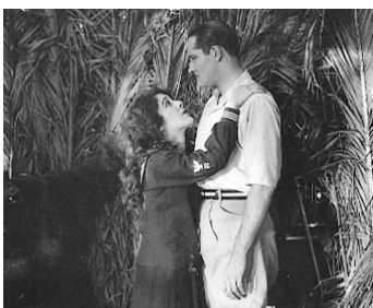
1925 L'ENFANT DE LA JUNGLE (Lorraine of the Lions) d'Edward Sedgwick avec Norman Kerry