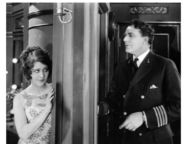
1924 HEAD WINDS d'Herbert Blaché avec House Peters