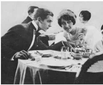
1926 BROKEN HEARTS OF HOLLYWOOD de Lloyd Bacon avec Douglas Fairbanks Jr