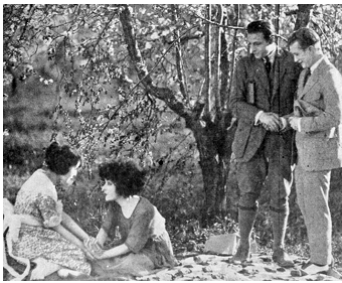
1921 LA DAME AUX CAMÉLIAS (Camille) de Ray Smallwood avec Alla Nazimova, R. Valentino