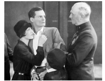
1927 WHAT EVERY GIRL SHOULD KNOW de Charles Reisner avec Ian Keith, Carroll Nye