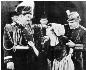
1922 LE MASQUE DE LA FORTUNE (Fortune's Mask) de Robert Enswinger avec Oliver Hardy