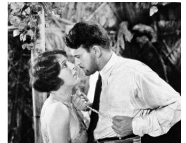
1928 PASSIONS SOUS LES TROPIQUES (Tropical Nights) d'Elmer Clifton avec Wallace McDonald