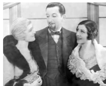
1930 LONELY WIVES de Russell Mack avec Laura La Plante, Edward Everett Horton