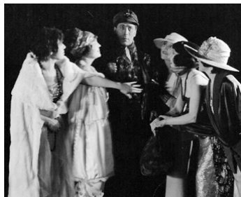
1923 CŒUR DE BRIGAND (Singer Jim McKee) de Clifford Smith avec William S. Hart