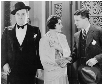
1929 THE FALL OF EVE de Frank R. Strayer avec Arthur Rankin, Ford Sterling