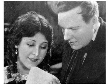
1922 PREMIER AMOUR (The Girl I loved) de Joseph De Grasse avec Charles Ray