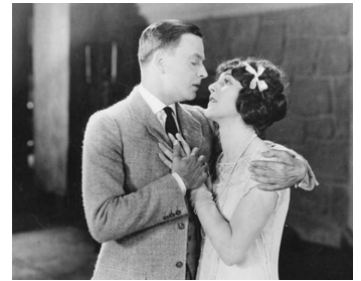
1923 AMOUR, QUAND TU NOUS TIENS (The Yankee Consul) de James V. Horne avec Douglas MacLean