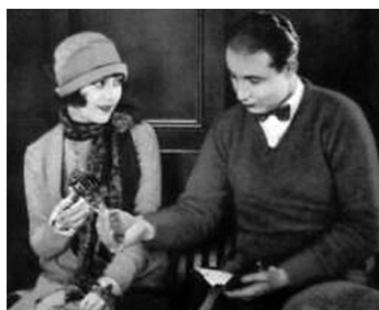
1925 RED HOT TIRES d'Erle C. Kenton avec Monte Blue