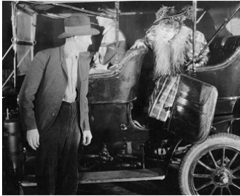
1927 SA PREMIÈRE AUTO (The First Auto) de Roy Del Ruth avec Russell Simpson