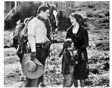
1922 LA MANIÈRE FORTE (For big Stakes) de Lynn Reynolds avec Tom Mix, Bert Sprotte