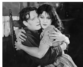
1926 L'HYPOCRITE (Hell bent for heaven) de James Stuart Blackton avec John Harron