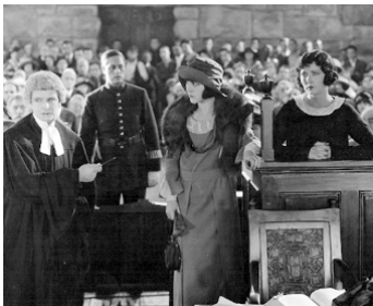
1923 LE GLAIVE DE LA LOI (Name the Man) de V. Sjöström avec Creighton Hale, Mae Busch