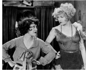
1927 SHANGHAIED de Ralph Ince avec Gertrude Astor