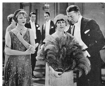
1925 WHY GIRLS GO BACK HOME de James Flood avec Myrna Loy, Clive Brook