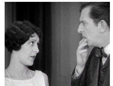
1929 WIDE OPEN d'Archie Mayo avec Edward Everett Horton