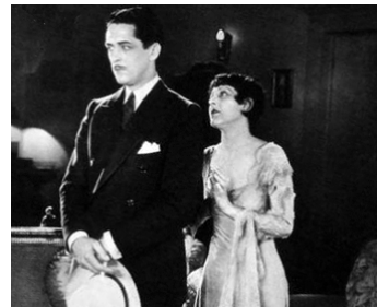
1928 BEAUTIFUL BUT DUMB d'Elmer Clifton avec Charles Byer