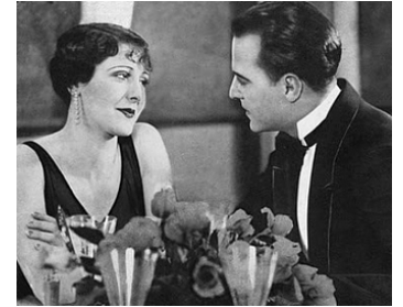
1927 AMOUR DANS LES MERS DU SUD (South Sea Love) de Ralph Ince avec Lee Shumway