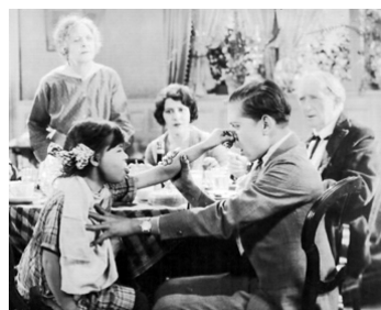
1925 ROSE OF THE WORLD d'Harry Beaumont avec L. Knott, C. Clark, E. Peil, Allan Forrest