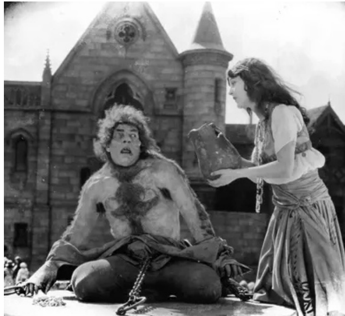
1923 NOTRE-DAME DE PARIS (The Hunchback of Notre Dame) de Wallace Worsley avec Lon Chaney