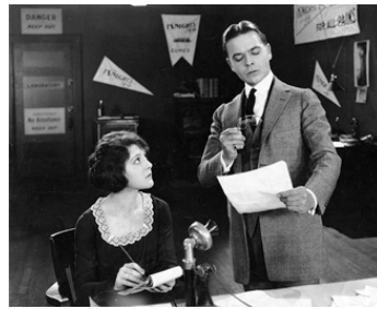
1921 ONE A MINUTE de Jack Nelson avec Douglas MacLean