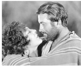
1926 SOUS LE REGARD D'ALLAH (The white black Ship) de Sidney Olcott avec Richard Barthelmess