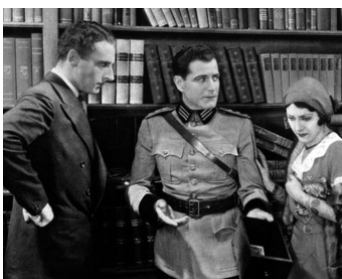
1930 THE LAST OF THE LONE WOLF de Richard Boleslawski avec Henry Daniell, Bert Lytell