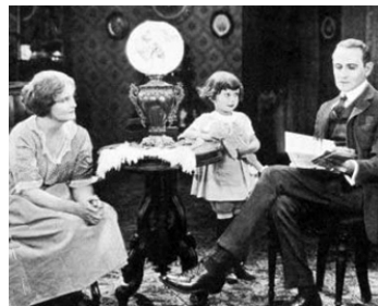
1924 A SELF-MADE FAILURE de William Beaudine avec Lloyd Hamilton