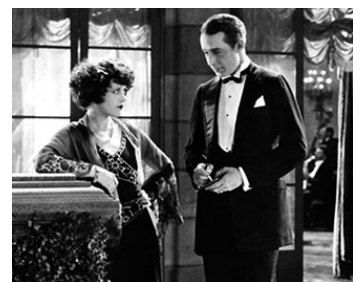
1926 LES SURPRISES DE LA TSF (So this is Paris) d'Ernst Lubitsch avec Monte Blue