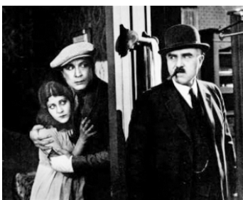
1925 POUR LES BEAUX YEUX DE PATSY (Hogan's Alley) de R. Del Ruth avec M. Blue, Fred Kelsey