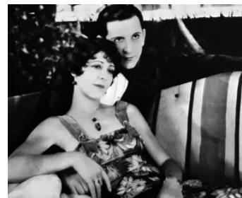
1929 L'AVIATEUR (The Aviator) de Roy Del Ruth avec Edward Everett Horton