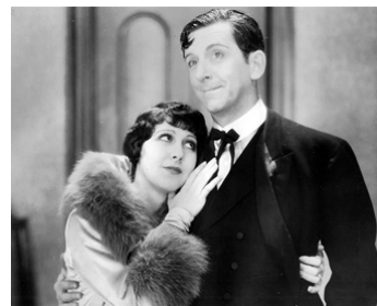
1929 LA SÈVE (The Sap) d'Archie Mayo avec Edward Everett Horton