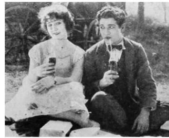
1921 LE CRIME DE ROGER SANDERS (Watch your step) de W. Beaudine avec Cullen Landis